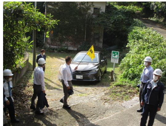
指定避難場所：全員無事到着できたことを 確認。