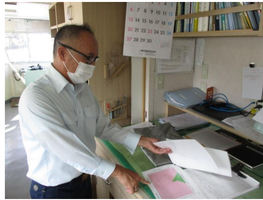
ブリッジ：お客様に無事下船いただいた後 本船の係留強化を指示