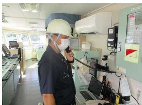
関係機関に船内火災発生を通報