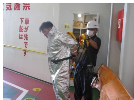
消防員装具を装着