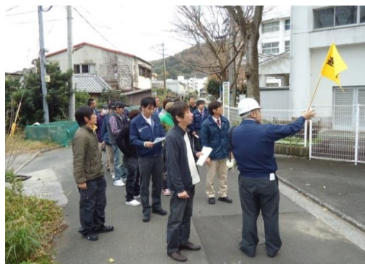
指定避難場所へ誘導