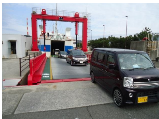
遙かぜからお客様下船