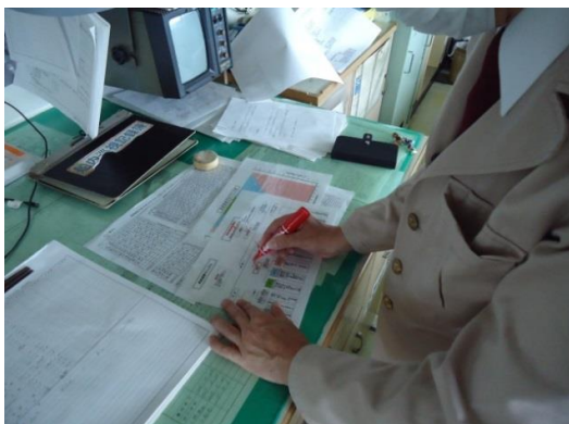
【遙かぜ】運航計画を判断

訓 練 概 要 遙かぜが三崎港出航直後、高知県沖を震源地とする地震から津波が発生したと想定。 本船は三崎港に係留し、お客様への情報提供や指定避難場所へ誘導を行う。