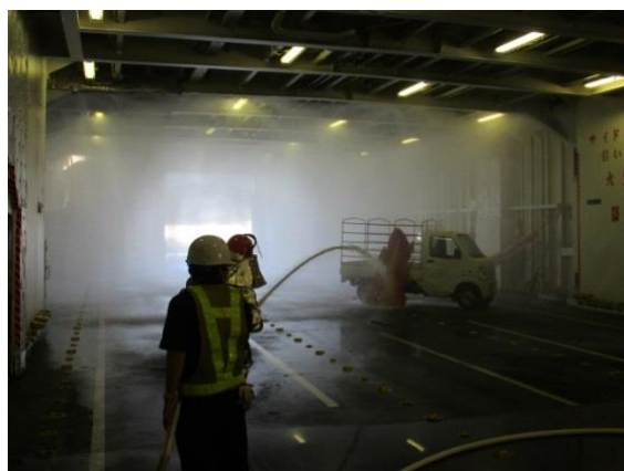
スプリンクラー散水