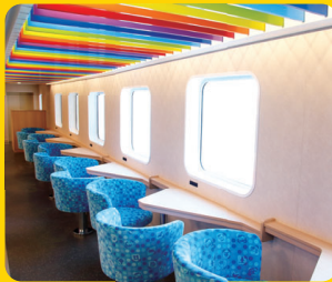
一般席(カウンター席)