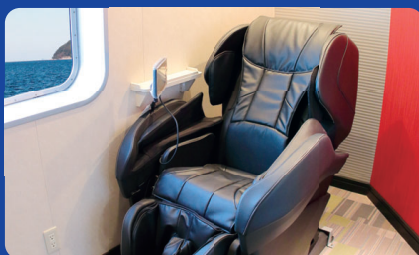
マッサージチェア室